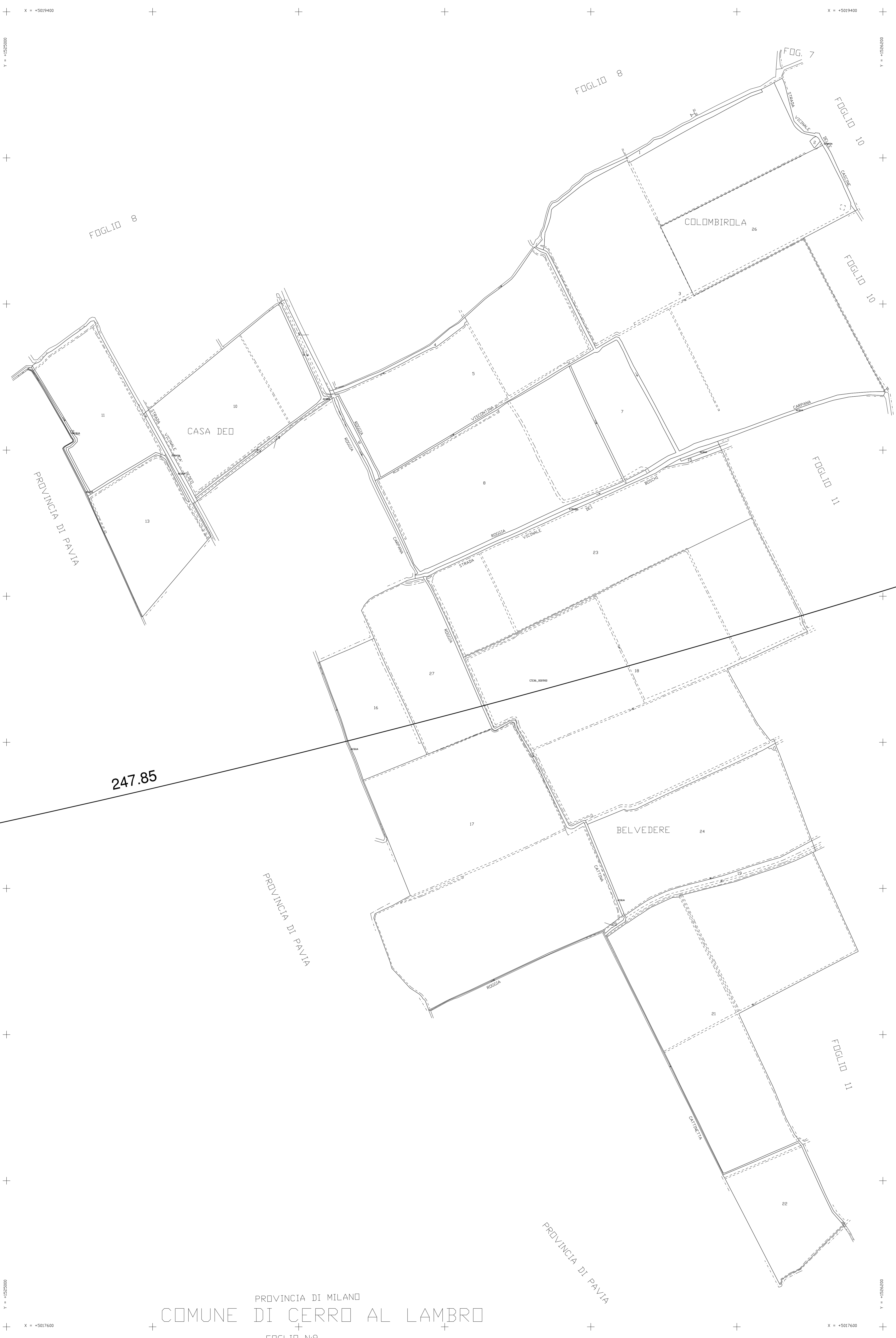
QUADRO D'UNIONE COMUNE